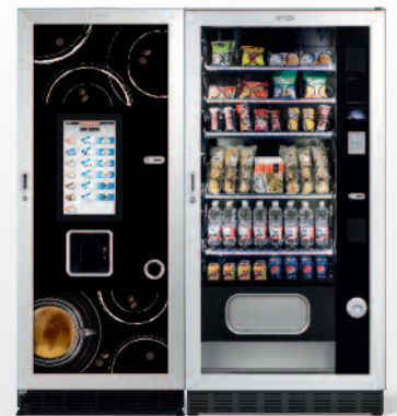
Winning GCD Touch + Faster TMT GCD 900