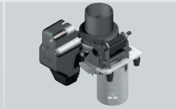
Zwei professionelle Mahlwerke mit Flachklingen MF1