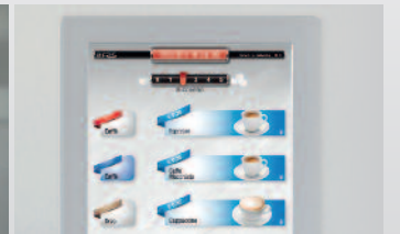
Touchscreen mit ausgezeichneten Leistungsmerkmalen