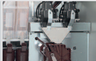
Zwei unabhängig voneinander gemahlene und dosierte Kaffeesorten